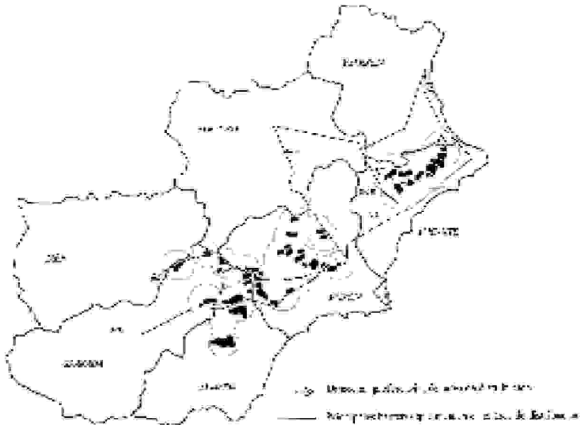
Figura 3. Principales barreras que modelan la distribución y posibles rutas de dispersión del árrui en el Sureste Ibérico

núcleo alicantino ocupa menor superficie, debido en parte a su reciente creación. Su área de distribución posee una dirección preferencial SO-NE. Esto nos hace sugerir la próxima colonización del sur de la provincia de Valencia, ya que entre ambas provincias existen serranías compartidas.