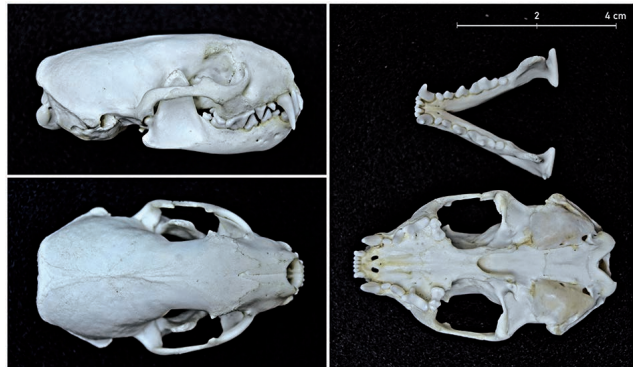
Figura 6. Cráneo de turón perteneciente a un macho adulto recogido atropellado (Simancas, Valladolid, julio 2018).

de hurones, pero en éstos la región postorbital es más estrecha.