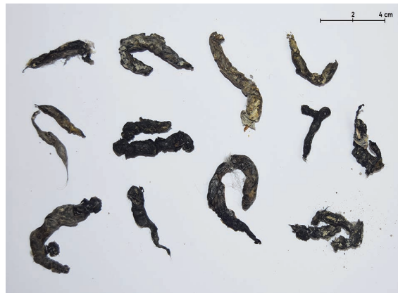
Figura 4. Excrementos de turón. Recogidos en pasos subterráneos de autovía (Santovenia de Pisuerga, Villanubla y Simancas, Valladolid en 2023).

En cuanto a la coloración, los excrementos suelen ser muy oscuros, en ocasiones verdosos, cuando son frescos y se vuelven grisáceos con el paso de los días. Sobre su consistencia, son generalmente compactos y difíciles de desmenuzar. Habitualmente es posible apreciar su contenido, que puede incluir materia fecal, pelo y restos de huesos o uñas de sus presas. Los excrementos frescos desprenden un olor fuerte, desagradable y bastante característico que, si se conoce, puede ayudar en su identificación.