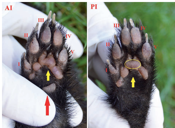
Figura 1. Extremidades de un macho adulto de turón. AI (extremidad anterior izquierda), PI (posterior izquierda), I (pulgar), II (índice), III (medio), IV (anular), V (meñique). La flecha roja señala la almohadilla carpiana, ausente en extremidades posteriores, las flechas amarillas indican las almohadillas metacarpianas y el círculo amarillo marca el lóbulo central de la almohadilla metacarpiana que en esta especie es ovalado. Obsérvese también cómo las uñas de las manos presentan mayor longitud.