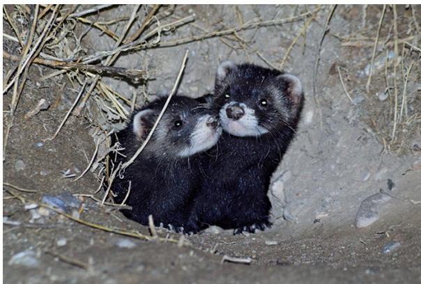
Figura 5. Cachorros de turón en una hura de conejo (Valladolid, julio 2019).

Gracias a su cuerpo alargado el turón puede moverse con facilidad bajo tierra. Aunque no son malos excavadores, prefieren adaptar madrigueras de otras especies (principalmente de conejos). Se ha observado a los turones ocupando huras de conejo para criar (figura 5). Tienen a cambiar de refugio con frecuencia, siempre buscando zonas dentro de su