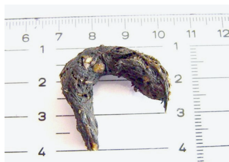
Figura 3. Excremento de visón europeo (14/11/2007. Peralta, Navarra).

En ambas especies, las heces contienen frecuentemente pelos del propio animal que ha depositado el excremento, junto a restos no digeridos de su amplia variedad de presas: fragmentos del exoesqueleto de cangrejos, pelos de mamíferos, pequeños huesos, plumas de aves, y