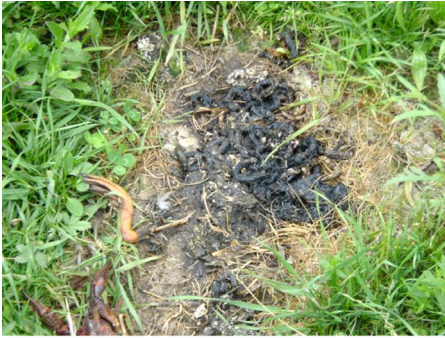
Figura 4. Letrina de un grupo familiar de visón americano (22/06/2002. Vitoria-Gasteiz, Álava).

escamas de peces y reptiles. El olor de sus heces es diferente del característico olor "agradable" o "acaramelado" de las heces de nutria, por lo que resulta un carácter diferenciador con esta especie.