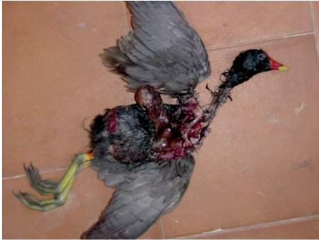
Figura 6. Gallineta común Gallinula choropus (Linnaeus, 1758) devorada en cuello y pecho por visón europeo. (19/04/2002. Vitoria-Gasteiz, Álava).

curioso o confiado. Por el contrario, el visón europeo es una especie muy discreta, que permanece oculta en su intrincado hábitat, de modo que su presencia suele pasar bastante desapercibida.