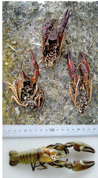
Figura 5. Arriba: tres cefalotórax de cangrejo rojo Americano Procambarus clarkii (Girard, 1853 ) depredados y recogidos en una madriguera de cría de visón europeo el 07/07/2007 en Peralta (Navarra). Abajo: cangrejo señal Pacifastacus leniusculus (Dana, 1852) depredado por visón americano. (21/10/2001. Vitoria-Gasteiz, Álava).

Informaciones de lugareños sobre observaciones reiteradas de "nutrias", y a corta distancia, pueden corresponder en realidad a visones americanos, dado que estos animales pueden mostrar un carácter