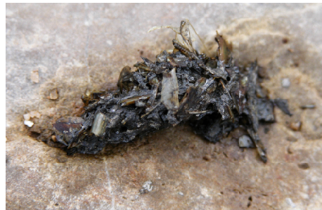
Figura 4. Excremento de nutria con abundantes restos de peces. Tarifa (Cádiz).

excrementos suelen ser cilíndricos y algo retorcidos (figura 4). En ellos encontraremos frecuentemente huesos y escamas de peces y piezas del exoesqueleto de cangrejos de río. También pueden aparecer huesos de anfibios, restos de reptiles (piel de culebras, placas de galápagos,...) y pequeños artrópodos (insectos, camarones). Raramente restos de aves y mamíferos, mientras los restos vegetales son resultado de un consumo accidental (nunca aparecen, por ejemplo, semillas de frutos carnosos). Además, en el 32,9% de 632 excrementos recogidos en el Prepirineo catalán, había pelos de nutria.