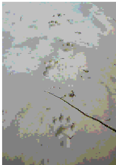
Figura 3. Rastro de nutria desplazándose al galope lateral largo. Coripe (Sevilla) (fotografía J. Calzada).

variación en la distancia de avance (tabla 2). Nosotros hemos clasificado el galope lateral como corto o largo en función de que el primer pie (en el sentido de avance) quede ligeramente por detrás o a la misma altura que la segunda mano (galope lateral corto) o claramente por delante de ésta (galope lateral largo, figura 3).