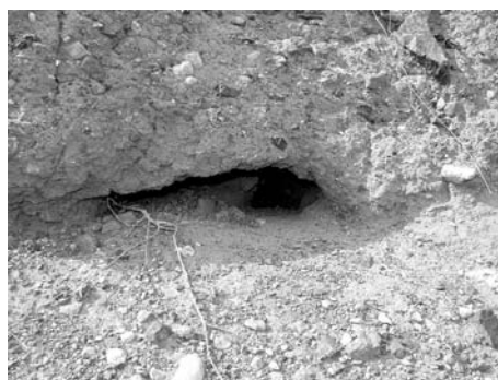
Figura 3. Madriguera de ardilla moruna en la isla de Fuerteventura. Fabricada en terreno arcilloso, pueden apreciarse algunos excrementos de ardilla que suelen descubrir las entradas a las madrigueras.

entrada es difícil de distinguir, ya que los animales pueden entrar y salir por los diferentes huecos que forman las piedras del muro. En el caso de las madrigueras hechas en el suelo o arena, la boca no supera los 10 cm. de alto y los 10 cm de ancho (Figura 3). Aunque la morfología de la madriguera varía, la cámara no suele tener ramificaciones y la longitud no supera los 2 m. Al nido transportan un conjunto de materiales que colocan ordenadamente en el suelo de la cámara. La visualización de adultos transportando material en la boca supone una ayuda eficaz a la hora de identificar la entrada del nido. Entre estos materiales aparecen restos vegetales frescos o secos, además de restos de cuerdas o telas.