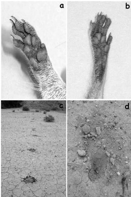
Figura 4. Restos de huellas de ardilla moruna: a. Mano de ardilla moruna; b. Pie de ardilla moruna; c. Restos de la huella de ardilla moruna dejada en un sustrato arcilloso inmediatamente después de haber llovido; d. Revolcadero de ardilla moruna de unos 10 cm de largo y 3-5 cm de ancho.

Otras marcas frecuentes son los revolcaderos, oquedades en el terreno de alrededor de una decena de cm. de largo, que aparecen como resultado de los continuos baños de arena que se dan estos animales (Figura 4d).