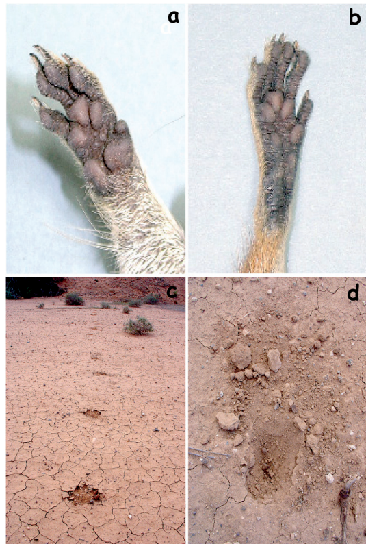
Figura 4. Restos de huellas de ardilla moruna: a) mano de ardilla moruna; b) pie de ardilla moruna; c) restos de la huella de ardilla moruna dejada en un sustrato arcilloso inmediatamente después de haber llovido; d) Revolcadero de ardilla moruna de unos 10 cm de largo y 3-5 cm de ancho.