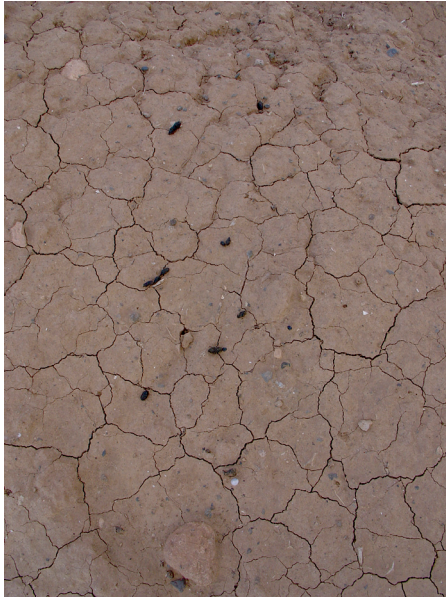
Figura 2. Excrementos de ardilla moruna de Fuerteventura, mostrándose las distintas tipologías de los excrementos (individuales y dobles o triples, unidos por pequeños filamentos).

de dos o tres unidos por una fina hebra. En ocasiones, se les encuentran pegados de dos en dos por los lados, apareciendo algo solapados (figura 2). El color de los excrementos varía según el alimento, aunque lo común es que sean de color negro intenso. Pueden ser verdes, con tonalidades oscuras y claras. En algunos casos pueden verse las semillas ( Opuntia , Rubia , Asparagus , Ficus , etc) o trozos de materia vegetal sin digerir totalmente (hebras de gramíneas, sobre todo).