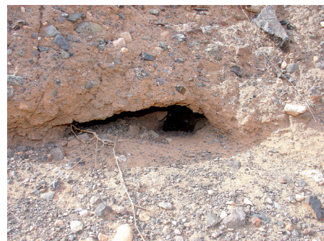
Figura 3. Madriguera de ardilla moruna en la isla de Fuerteventura. Fabricada en terreno arcilloso, pueden apreciarse algunos excrementos de ardilla que suelen descubrir las entradas a las madrigueras.

Las madrigueras pueden ser excavadas en el suelo arenoso y en pequeños taludes, o ubicarse en muros (muy habituales en el paisaje de Fuerteventura), entre los huecos que dejan las piedras entre sí. Esta última localización es la más frecuente. No obstante, la cámara del nido de estas madrigueras en muros siempre se encuentra en contacto con la superficie arenosa de la terraza. La boca de la madriguera es única, aunque cuando se trata de madrigueras fabricadas aprovechando la existencia de un muro la entrada es difícil de distinguir, ya que los animales pueden entrar y salir por los diferentes huecos que forman las piedras del muro. En el caso de las madrigueras