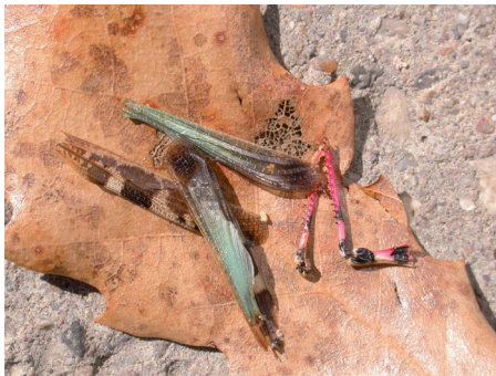
Figura 5. Restos de un ortóptero depredado por una Musaraña gris, Crocidura russula (fotografía de los autores del capítulo).