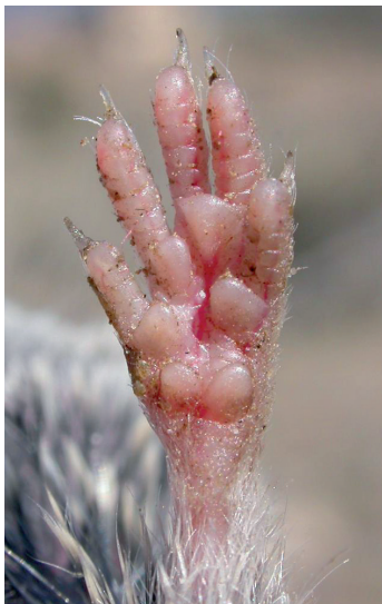
Figura 1. Mano de musaraña gris, Crocidura russula.