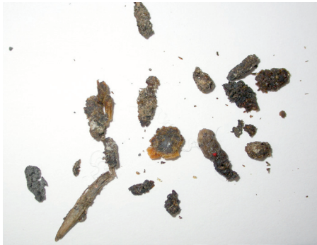
Figura 4. Excrementos de Musaraña gris, Crocidura russula (fotografía de los autores del capítulo).