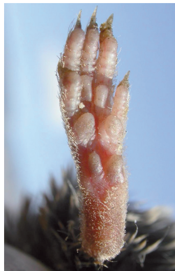
Figura 2. Pié de Musaraña gris, Crocidura russula.