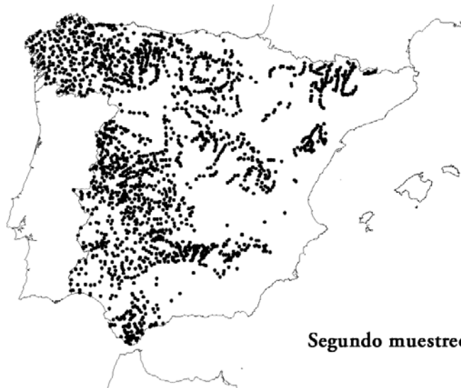
Segundo muestreo (1994-96)